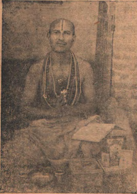
நேபாள மஹந்து--ராமா துஜதாஸ் ஸாளக்ராம கேஷத்ர மார்க்கத்திலுள்ள ஒரு மஹான்.

அடியேனுக்கு ஸ்ரீபதரிகாசர்ம பர்யந்தமான வடநாட்டு யாத்திரை பல முறை கிடைத்திருக்கிறதென்று முன்னமே (பக்கம் 88-லும், பக்கம் 154-லும்) விஜ்ஞாபித்திருக்கின்றேன். ஸாளக்ராம கேஷத்ர யாத்திரை ஒரு பர்யாயங்கூட